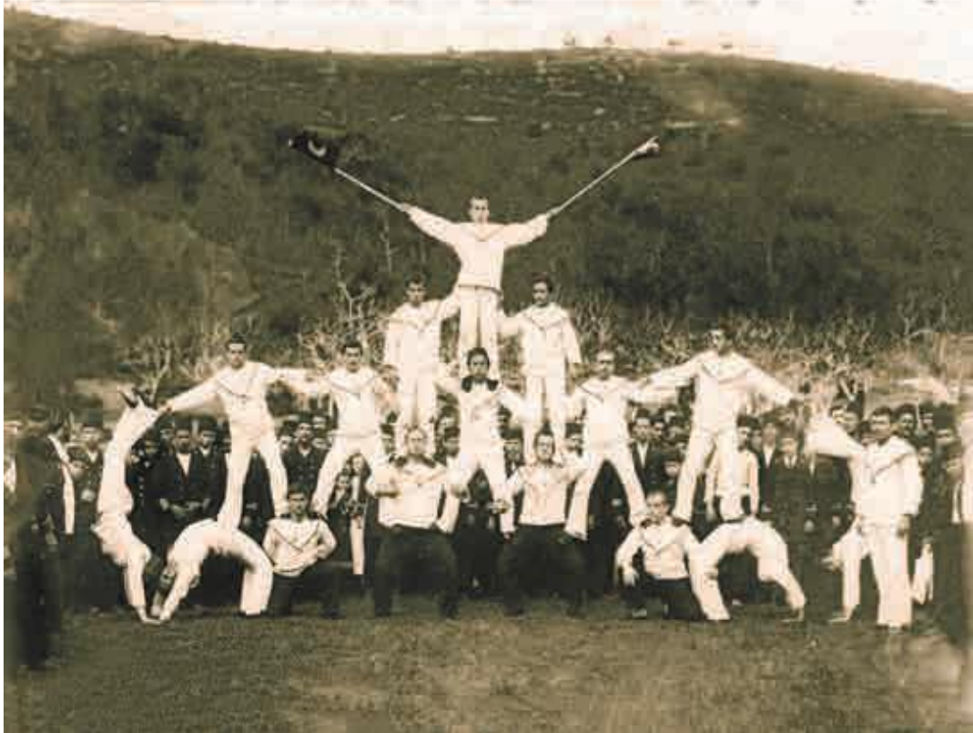
Fotoğraf 4. Mekteb-i Bahriye-i Şahane öğrencilerinin Çam Limanı mesiresinde jimnastik çalışmaları. (Eraslan, 2017: 124)