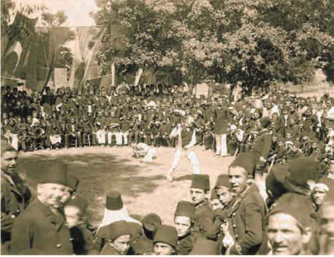
Fotoğraf 3. Mekteb-i Bahriye talebeleri Kâğıthane piknik alanında eğlence sırasında. (Eraslan, 2017: 123)