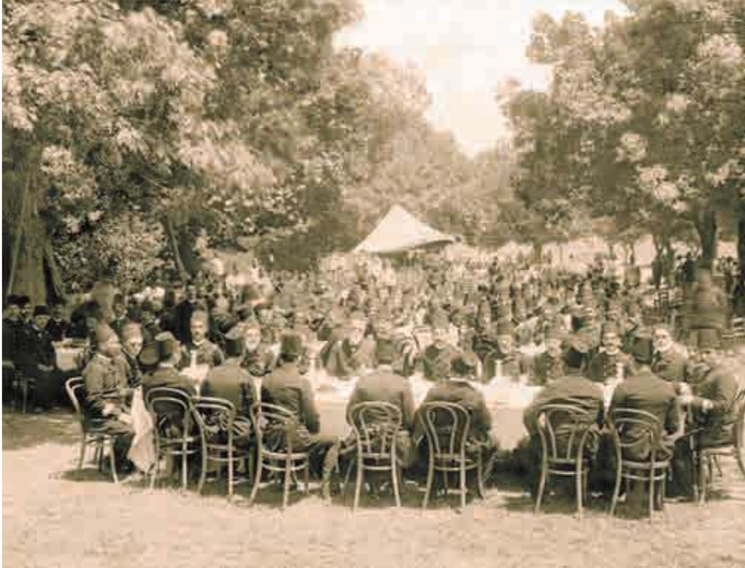
Fotoğraf-2. Heybeliada Bahriye Mektebi öğretmen ve öğrencileri Kâğıthane’de düzenlenen piknikte (Eraslan, 2017: 122)